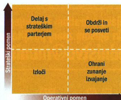
Slika 2: Razlogi za najem zunanjih storitev pri slovenskih podjetjih

bomo potrebovali ljudi z »dragimi« veščini; in ko se bomo preprosto želeli znebiti kakega posla ali procesa. Ključni dejavnik pri odločitvi o najemu zunanjih storitev IT bo seveda pričakovana poslovna korist naše odločitve. Bo najem znižal stroške? Izboljšal operacije? Izboljšal zmogljivosti poslovanja?